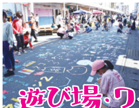
遊び場・ワークショップ